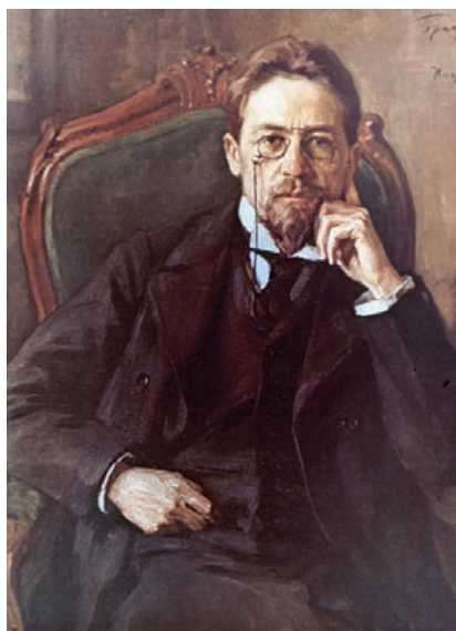
Писатель Антон Павлович Чехов.

Новый хозяин был добрым и хорошо её кормил 9 . Но она часто вспоминала столяра и Федюшку и очень грустила 10 .