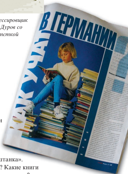
Статья в журнале «Огонёк» о школах и школьниках Германии