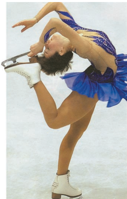
Известная российская фигуристка Ирина Слуцкая