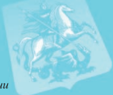
Москва – столица России