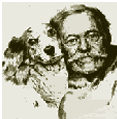
Известный русский дрессировщик Владимир Леонидович Дуров со своей талантливой артисткой Тёткой (Каштанкой)

А Чехов закончил рассказ по-другому. Каштанка уходит из цирка со столяром и Федюшкой. Она радуется жизни и тому, что она возвращается домой.