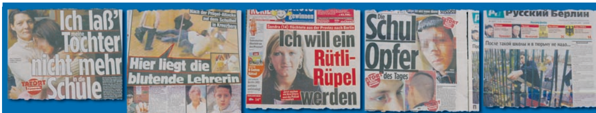
Газеты о ситуации в некоторых школах Германии