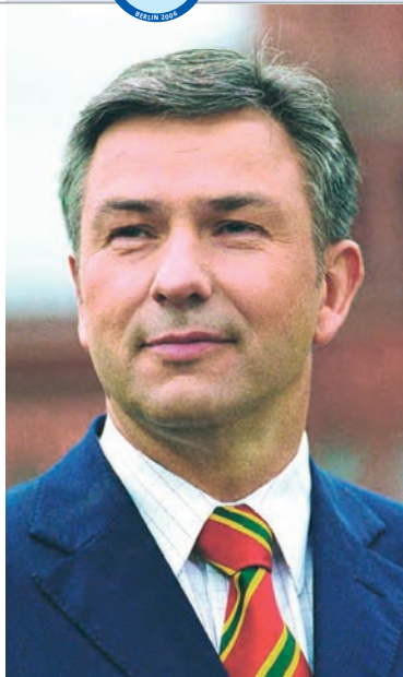
Клаус Воверайт – правящий бургомистр Берлина