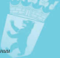
Берлин – столица Германии